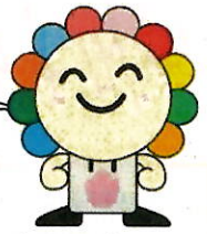
さいたま市選挙キャラクター 「みらいクン」

選挙の大切さや投票の参加を呼びかけ、明るい選挙を実現するために役立つ 印象深いイメージのポスターを児童・生徒の皆さんから募集します!!